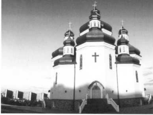
Наш вибір НАША УКРАЇНА Овсеп Мікртчян