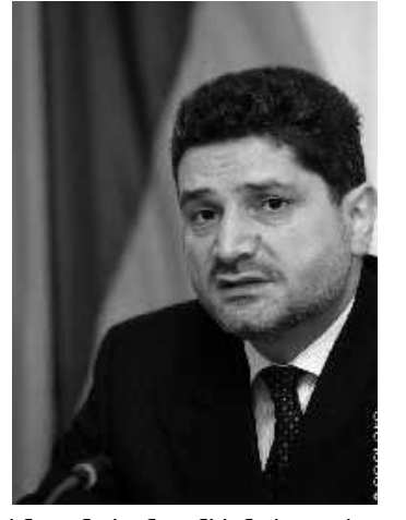
Կենտրոնական բանկի նախագահ 2005-2007 - Միջպետական բանկի խորհրդի նախագահ Ընտանիքը Ամուսնացած է, ունի մեկ դուստր և մեկ որդի: Անկուսակցական է:

1988-1993 - Երիտասարդ մասնագետների և գիտնականների հանրապետական խորհուրդ, նախագահ 1990-1991 - Տնտեսական բարեփոխումների հիմնախնդիրների վերաբերյալ բանկիրների համար կազմակերպվող մշտական սեմինարների կոորդինատոր 1993-1994 - Երևանի պետական համալսարան, բանկային գործի դասավանդում ՀՀ Գերագույն խորհրդի պատգամավոր, ՀՀ Գերագույն խորհրդի ֆինանսավարկային և բյուջետային հարցերի մշտական համեմատողական նախագահ